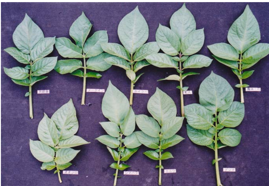
(6) その他の特性 葉の比較