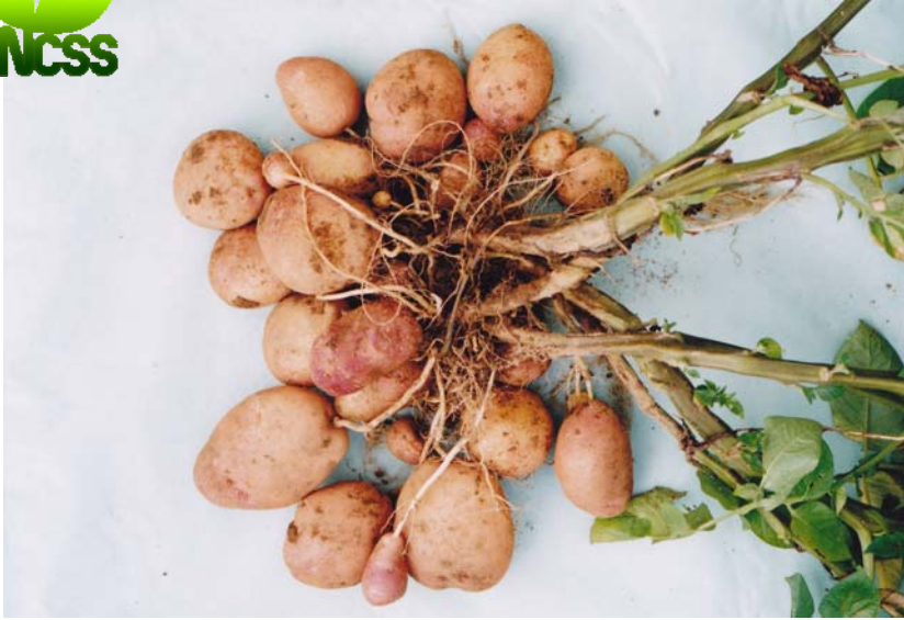
(4) 塊茎の着生状況 ふく枝の長さは中 いもの粒ぞろいは良