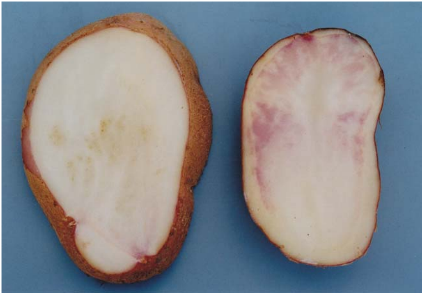
(5) その他の特性 塊茎内部の異常 写真左：褐色心腐病の発生がある 写真右：維管束部とその周辺部に 淡赤色の2次色がみられ ることが多い